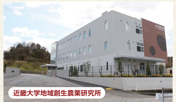
近畿大学地域創生農業研究所

地域創生農業研究所は、紀伊半島西部海岸の中央部にある“有田ミカン”の本場、さらに醤油発祥の地として、全国的に有名な和歌山県有田郡湯浅町に立地しています。マンゴーなど熱帯果樹類の栽培研究や、柑橘類の品種を系統保存すると同時に機能性を見出す薬用利用の研究などに取り組んでおり、研究者や農業従事者からも注目を集めています。また、学生実習にも毎年利用され、卒業研究の場としても利用されています。